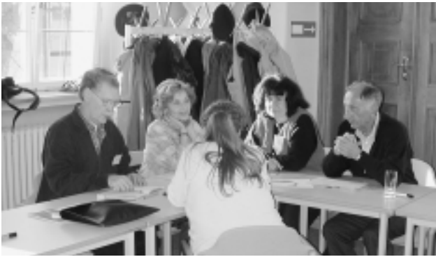
5. 5人のグループ討議の風景