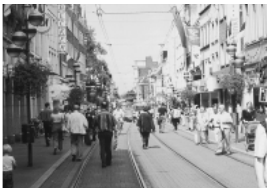
2. ノイス市の中心市街地